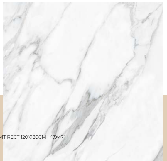
EJEMPLO CARAS DESARROLLO GRÁFICO / EXAMPLES FACES GRAPHIC DEVELOPMENT EVEN WHITE MT RECT 120X120CM · 47X47"